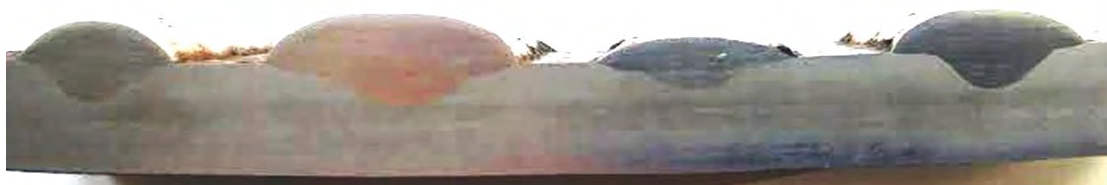
Рис. 1. Макрошліфи з типових наплавлених валиків

Типовий макрошліф наплавлених валиків для різних дослідів показано на (рис. 1). Далі виконувалося хімічне контрастування 4 % розчином азотної кислоти ( HNO_3 ) в етиловому спирті та встановлення геометричних параметрів швів.