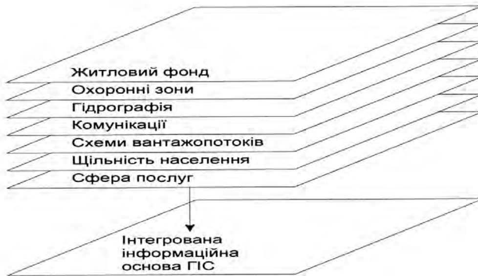
Рис.2. Приклад шарів інтегрованої ГІС

взаємовідносин містобудування і ГІС. Для полегшення розгляду і вивчення проблеми нам необхідно дефініювати поняття "містобудівельні ГІС". У законі України "Про основи містобудування" подане таке визначення: "Містобудування (містобудівельна діяльність) - це цілеспрямована діяльність державних органів, органів місцевого і регіонального самоврядування, підприємств, установ, організацій, громадян, об'єднань громадян для створення і підтримки повноцінного життєвого середовища, що включає прогнозування розвитку і планування територій, проектування, будівництва і реконструкції об'єктів житлово-громадського, промислового призначення, спорудження інших об'єктів, регенерацію історичних поселень, реставрацію архітектурних комплексів і ансамблів, створення інженерної і транспортної інфраструктури". Отже, до сфери впливу містобудівельних ГІС можна віднести автоматизовані системи із збирання, обробки, аналізу просторово розподілених даних, що стосуються комплексного розвитку міських територій.