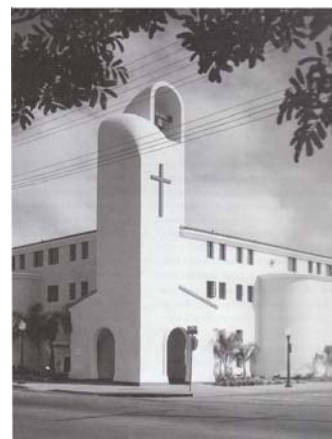
Рис. 2. Центр Джона Кроса в селі святого Вінсента де Поля, Сан Дієго