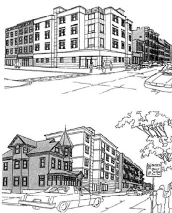
Рис. 1. Притулок. Будинок-вставка у США. Придатний до будь-яких типів міст, включаючи кутове розташування

1.4. Розташування мобільного житла за околицями міста;