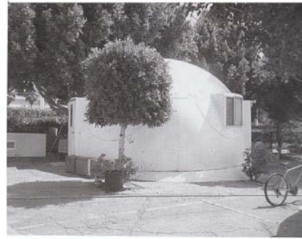
Рис. 4. Житло в с. Домед Лос Анжелесі