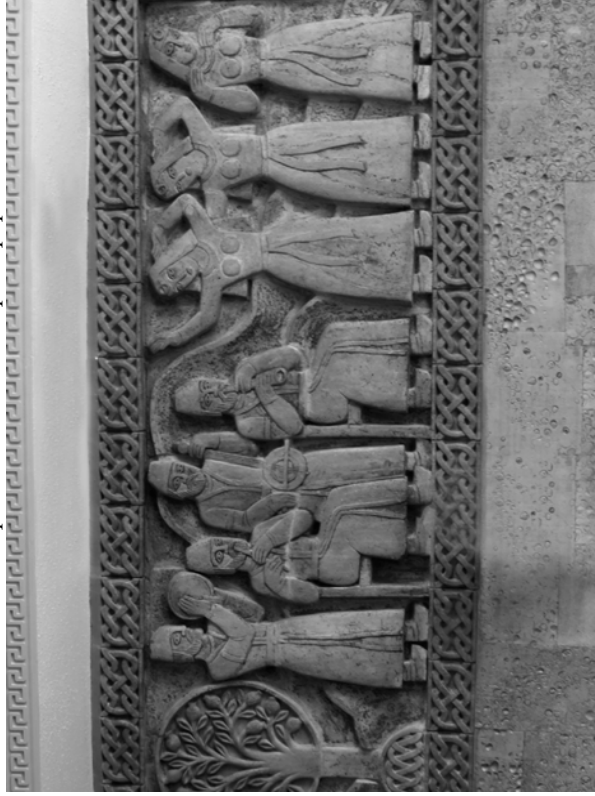
Рис. 5. Фрагмент панно в барі "Арарат"