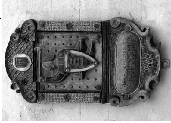
Рис. 8. Емблема Українського товариства охорони пам'яток історії та культури