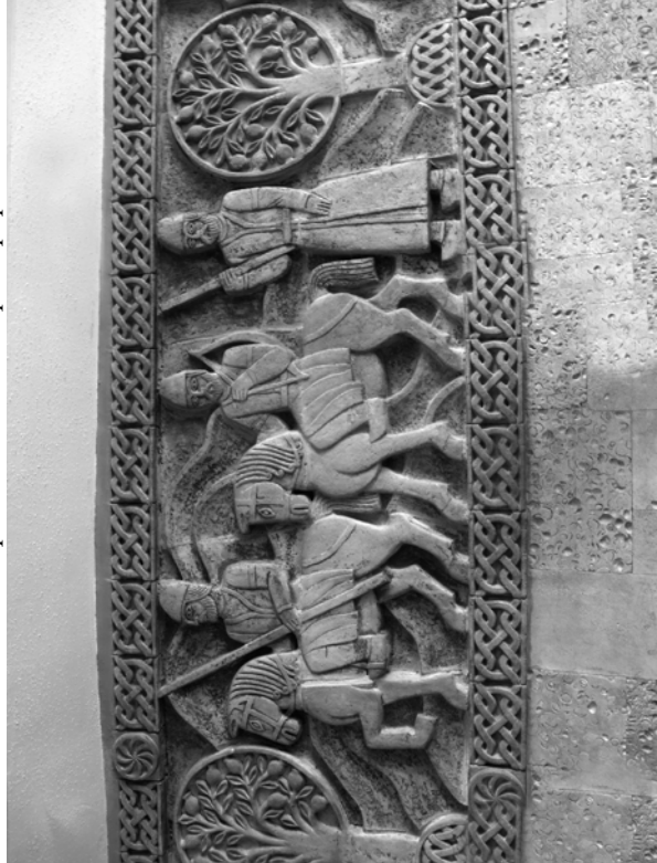
Рис. 4. Фрагмент панно в барі "Арарат"