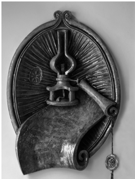
Рис. 1. Фрагмент оформлення аптеки № 24 (вул. Коперника, 1)

6. Декоративні пласти Я. Мотики у магазині “Жіноче взуття” (шамот, емалі) (пл. Міцкевича, 1).