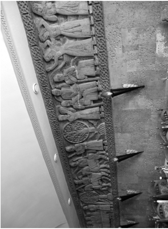
Рис. 2. Керамічне панно в барі "Арарат"