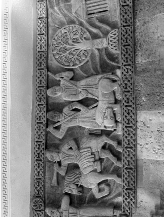
Рис. 3. Фрагмент панно в барі "Арарат"