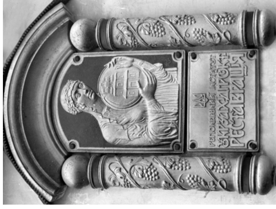
Рис. 9. Емблема Регіонального інституту "Укрзахідпроектреставрація"