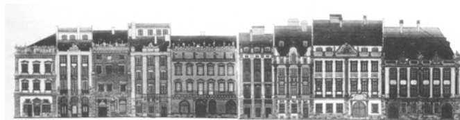
Рис. 1. Площа Ринок: загальний вигляд східної сторони, із будинком №10

Ця кам'яниця замикає південний ріг східного кварталу площі Ринок (рис. 1). А площа Ринок з часу свого заснування (у 1270 – середині XIV ст.) була центром „нового міста, яке збудували за принципами магдебурзького права” на південь від дерев'яного міста [13]. Архітектурний ансамбль Площі Ринок, до якого належить кам'яниця №10, сформувався „впродовж другої половини XVI–XVII ст., після міської пожежі 1527 р. як цілісний ренесансний ансамбль” [14]. Сучасного вигляду кам'яниці набули набагато пізніше від часу їх закладання, бо будувались на місці попередніх.