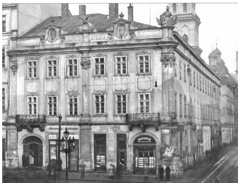
Рис. 5. Кам’яниця товариства” Просвіта”.

Товариство „Просвіта” надавало свої приміщення також для інших українських товариств, а саме: „Руської Бесіди” на першому поверсі (поруч з канцелярією „Просвіти” та залом засідань), „Клубу Русинок”, співацькому товариству „Боян” та академічному товариству „Ватра”. Дві кімнати на другому поверсі – Науковому товариству ім. Т. Шевченка, а також „таким інституціям, як „Дністер”, Краєвий Союз Ревізійний і багатьом менших фінансовим і культурним та професійним товариствам” [21], редакціям газет „Діло” і „Громадський голос”. На фото 1938 р. будинку „Просвіти” бачимо написи (вивіски цих організацій), а також напис, що ідентифікує власника кам’яниці, а саме: „ТОВАРИСТВО ”ПРОСВІТА”, який розташований на площині аттика (у проміжку між двома овальними люкарнами під скульптурою орла з картушем у центрі) (рис. 5).