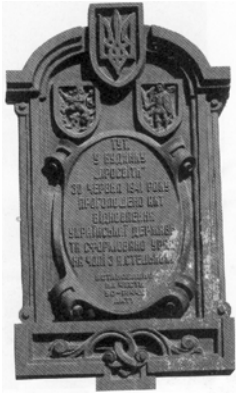
Рис. 6. Меморіальна таблиця на честь 50-річчя Акту відновлення Української Держави 30 червня 1941 р. (пл. Ринок, 10). Сучасне фото

Шептицького. У 1991 році на честь 50-річчя Акту відновлення Української Держави 30 червня 1941 року у Будинку “Просвіти” (пл. Ринок, 10) встановлена меморіальна таблиця [24], (рис. 6).