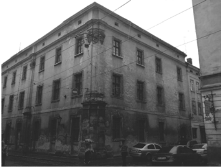
Рис. 3. Палац Любомирських, пл.Ринок,10 вул. Руська, 1. Сучасне фото