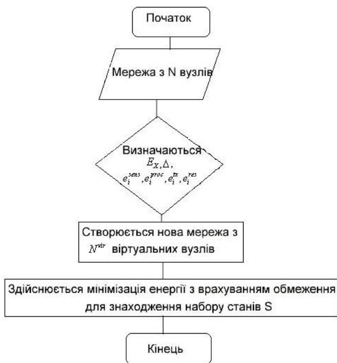
Рис. 1. Блок-схема пропонованого алгоритму

Запропонований алгоритм повинен знати точну топологію мережі, тобто як вузли з'єднані один з одним (матриця E_x ) і яка відстань між будь-якими двома з них (матриця \Delta ). Для обчислення загальної функції вартості потрібна додаткова інформація, така як параметри для моделювання радіоканалу, передавання, приймання, зчитування і оброблення споживання енергії кожного вузла, залишкова енергія кожного вузла, робоча частота і швидкість передавання даних.