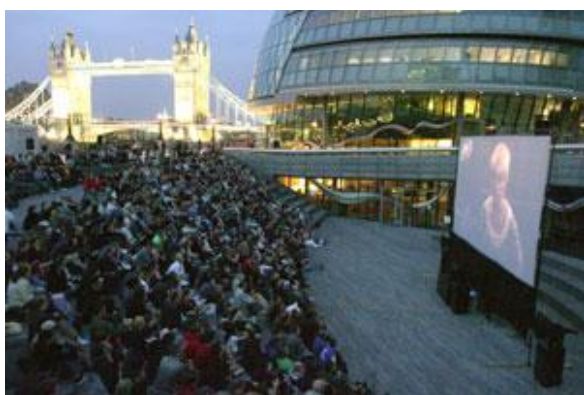
Рис.8. London, City Hall

Завдяки сучасним технологіям можна забезпечувати найрізноманітніші підсвітки сцен, створювати світлові ефекти. У звичайні дні для освітлення площі використовуються паркові ліхтарі. В період проведення дійства можна застосовувати як різноманітні прожектори, так і точкові світільники, залежно від того, якого ефекту необхідно досягти (рис. 9).