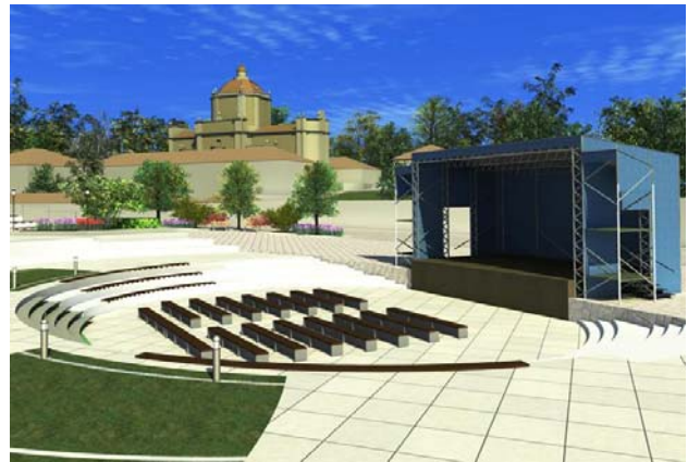
Рис.5. Пропозиції з використання площі для проведення концертів і фестивалів

Іншим варіантом використання площі може бути театр під відкритим небом (рис.6). Тут сцена може набувати найрізноманітнішої форми, яка залежатиме від характеру дійства і задуму режисера.