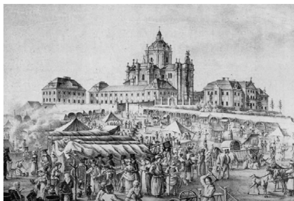
Рис.3. Ярмарок на пл. св. Юра (гравюра кін. XIX – поч. XX ст.)

Крім того, ідея створення площі-амфітеатру має історичне підґрунтя, адже тут, біля церкви св.Юра, до 1860–70 років традиційно відбувались знамениті святоюрські ярмарки, кипіло громадське життя (рис. 3).