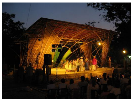
Рис.9. Приклади організації освітлення