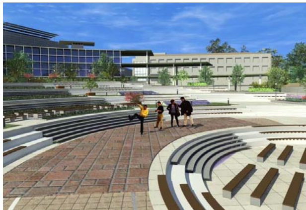
Рис.7. Нижня тераса

Ще одним способом пристосування площі під театралізоване дійство може бути використання нижньої тераси під глядацькі місця, а сценічним майданчиком слугуватиме тераса на рівень вище (рис. 7). Такий варіант підходить також для танцювальних шоу та інших дійств і вистав, що потребують достатньо вільного простору (акробатичні шоу, покази мод тощо).