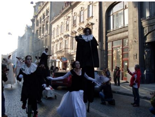
Рис.1. Відкриття театрального фестивалю “Золотий Лев”

Сучасне життя Львова багате на культурно-мистецькі події найрізноманітніших напрямків та стилів. Серед найвизначніших акцій – фестиваль класичної музики “Віртуози”, фестиваль сучасної музики “Контрасти”, фольклорні фестивалі, етно-джазовий фестиваль “Флюгери Львова”, фестиваль патріотичної пісні “Сурми звитяги”, фестивалі хорового мистецтва, театральні фестивалі “Драбина”, “Золотий лев” (рис.1), фестиваль ковальського мистецтва “Залізний лев”, Міжнародний фестиваль незалежного кіно “КіноЛев”, масові громадські заходи з відзначення державних, політичних і народних свят.