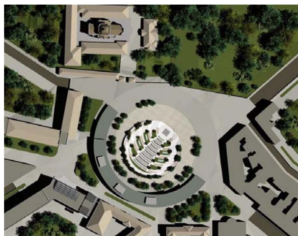
Рис.4. Генплан міжнародного студентського центру на базі бібліотеки Національного університету "Львівська політехніка"