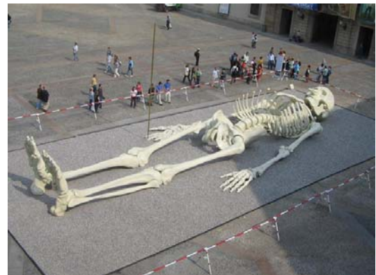
Рис.2. Мілан, Design week

Площі великих міст завжди багатолюдні. Тут практично безперервно відбувається якась дія: виступи мімів, вуличних музикантів, камерні театралізовані видовища (рис.2). У святкові дні місто перетворюється на суцільний театр. Тому для культурного міста важливо мати спеціальні місця, призначені для культурних дійств і масових видовищ під відкритим небом.