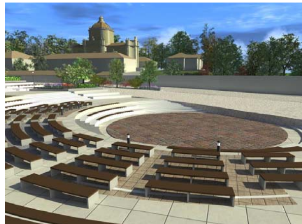
Рис.6. Театр під відкритим небом

Для театралізованого дійства як сцену можна використовувати нижню терасу, а глядачі розміщуватимуться на терасі рівнем вище.