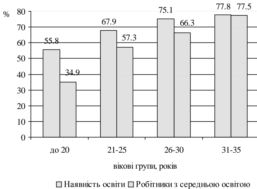
Рис. 2. Якість продукції, яку випускають робітники залежно від їх освітнього і вікового рівня