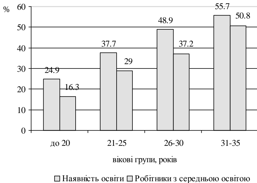
Рис. 3. Ініціативність робітників залежно від їх освітнього і вікового рівня

Освіта та професійна підготовка є фундаментом людського розвитку і прогресу суспільства. Вони також виступають гарантом індивідуального розвитку, плекають інтелектуальний, духовний та виробничий потенціали суспільства. Розвиток держави, структурні перетворення на мікро- і макроекономічному рівні мають гармонічно поєднуватися з реформою освіти та професійної підготовки для того, щоб задовольнити потреби і прагнення людей, особливо молоді, встановити систему цінностей, відповідати запитам людства щодо змін у сфері роботи як у громадському, так і в приватному секторах [4, с. 101].