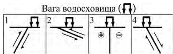
Рис. 1. Випадки ініціювання змін сейсмічної інтенсивності середовища, залежно від типу тектонічного розлому і його місця розташування відносно до водойми [Talwani, 1997]

П. Тальвані розглядає можливі випадки ініціювання змін сейсмічної інтенсивності місцевого геологічного середовища, залежно від типу сейсмічно активного тектонічного розлому і його місця розташування відносно водойми (рис. 1, табл. 1).