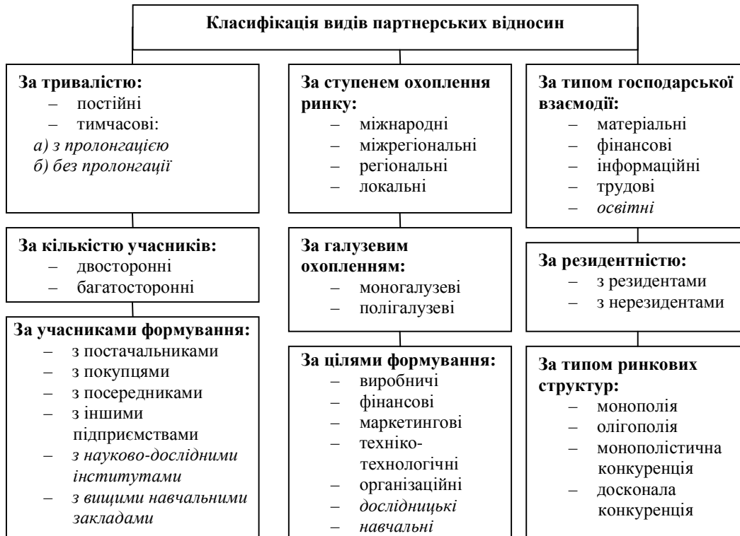
Рис. 1. Розвинута класифікація типів партнерських відносин підприємства * Курсивом зазначено види партнерських відносин, запропоновані автором

На рис. 1 зображено класифікацію партнерських відносин з урахуванням співпраці з ВНЗ.