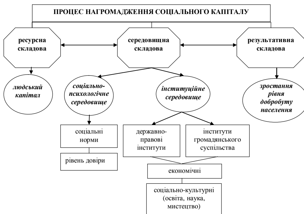
Рис. 1. Складові процесу нагромадження соціального капіталу економічної системи

Процес нагромадження соціального капіталу економічної системи може бути представленим єдністю трьох його складових: 1) ресурсна складова (людський капітал); 2) середовищна складова (соціально-психологічне та інституційне середовища); 3) результативна складова (рівень добробуту населення) (рис. 1).