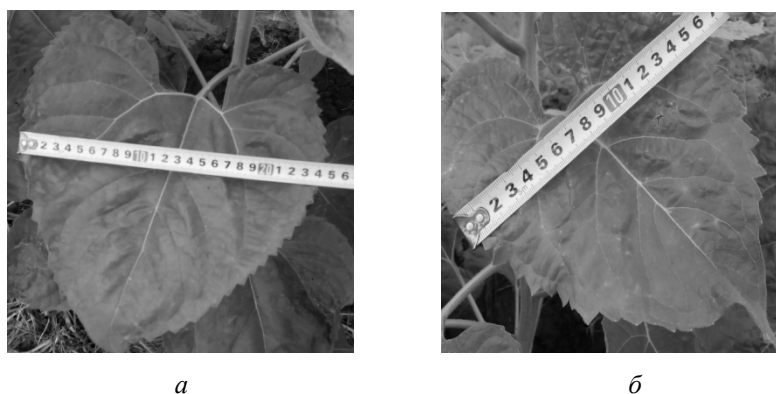
Рис. 1. Вплив рамноліпідних ПАР Pseudomonas sp. PS-17 на розміри поверхні листової пластинки соняшника за передпосівного оброблення насіння: а – супернатант культуральної рідини; б – контроль (вода)

Збільшення асиміляційної поверхні листя може бути пов'язано з інтенсивністю процесів фотосинтезу у рослин, тому доцільно визначити вміст фотосинтетичних пігментів у листі соняшника (рис. 2).