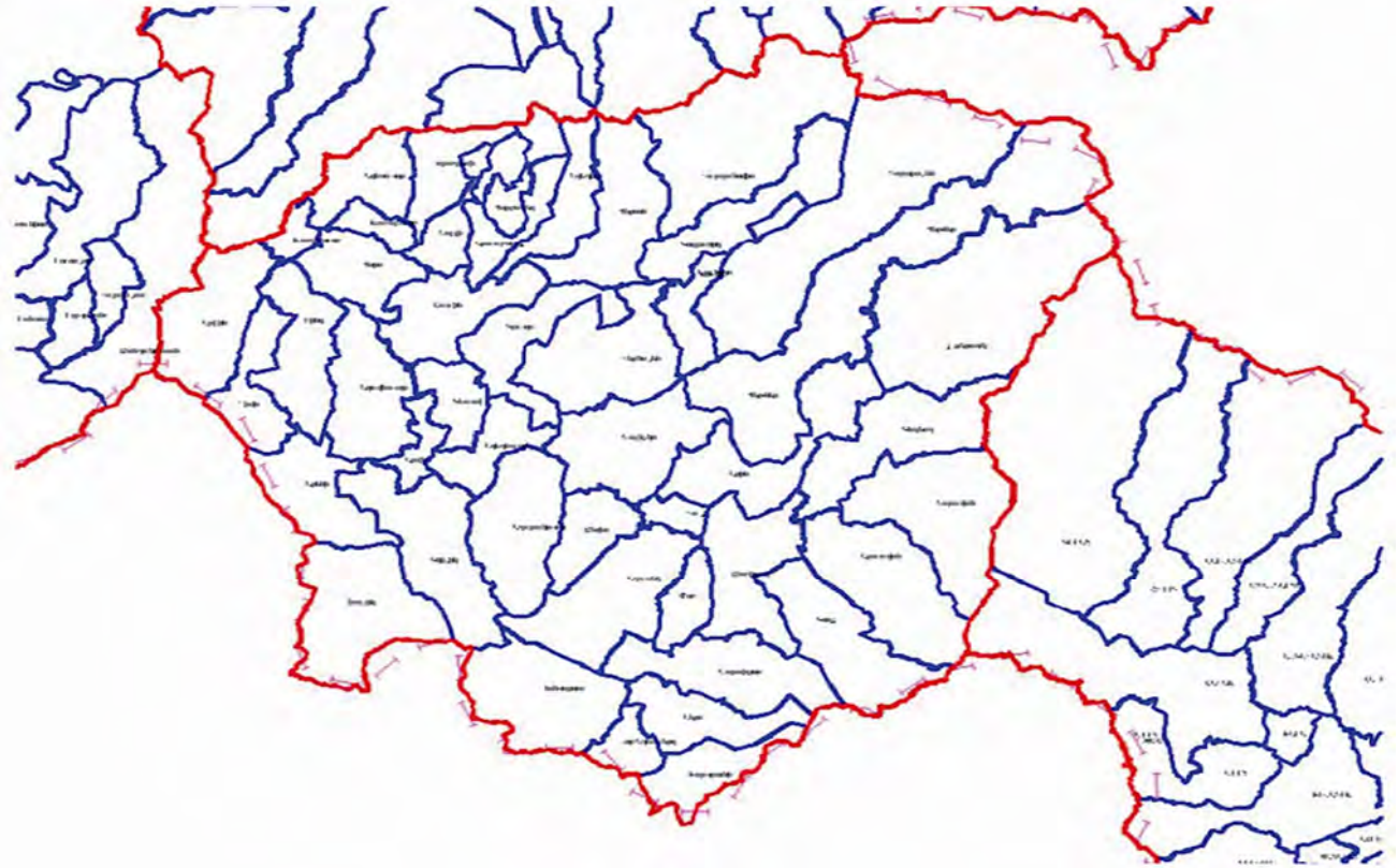
Рис. 1. Схеми землепользования по общинам