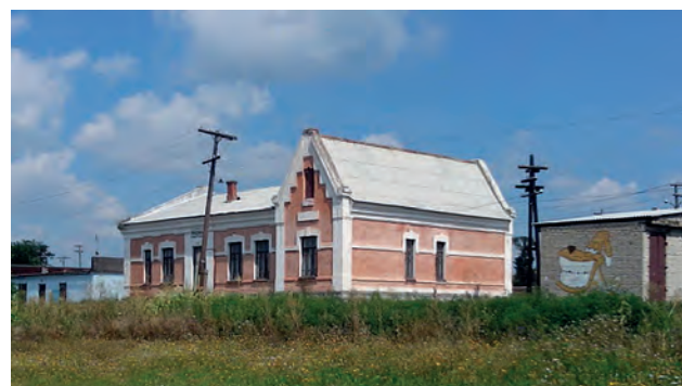
Рис. 2. Результати пошуку та спостереження за станом стінової марки № 1019