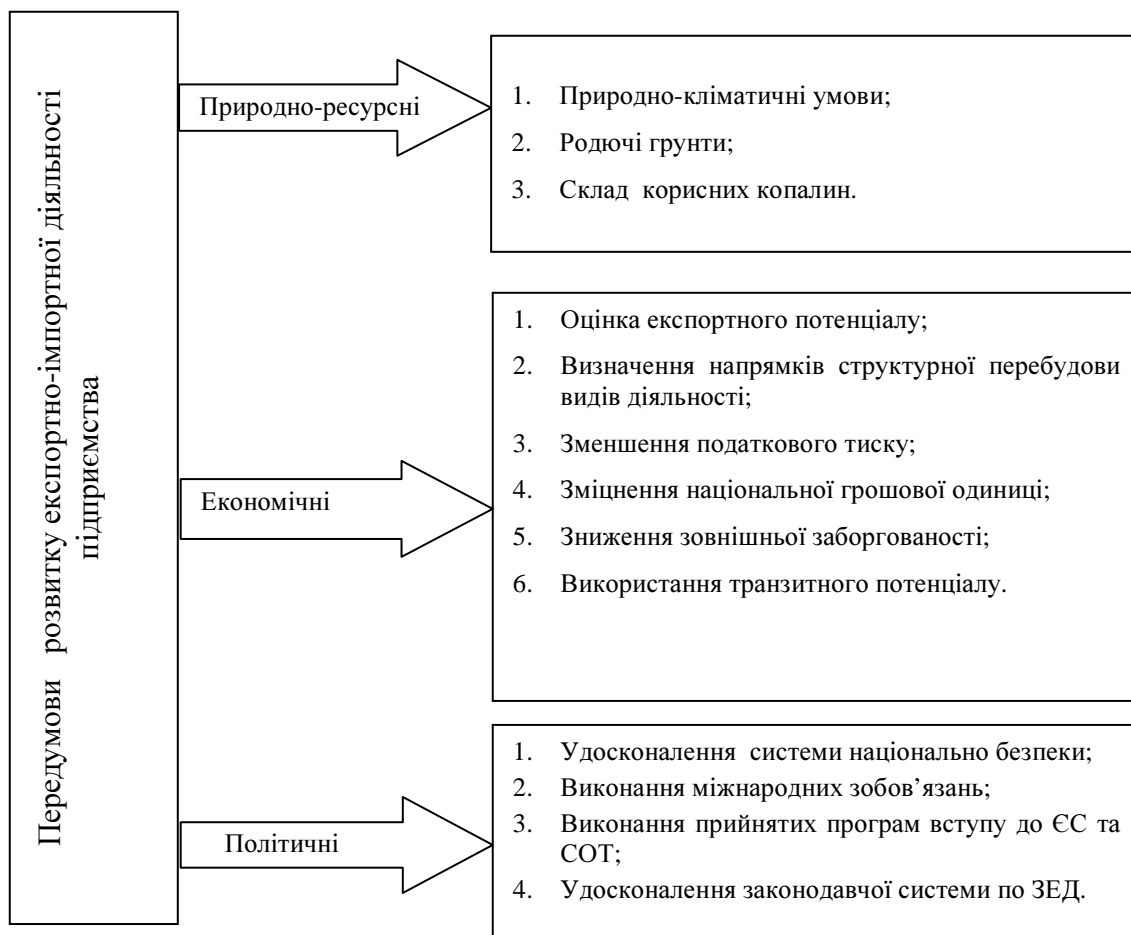
Рис. 2 Передумови розвитку експортно-імпоротної діяльності підприємств України

Проаналізувавши все вищенаведене, можна виділити ресурсні, політичні, та економічні передумови розвитку експортно-імпоротної діяльності та ті, що впливають з класичних теорій міжнародної торгівлі (рис. 2).