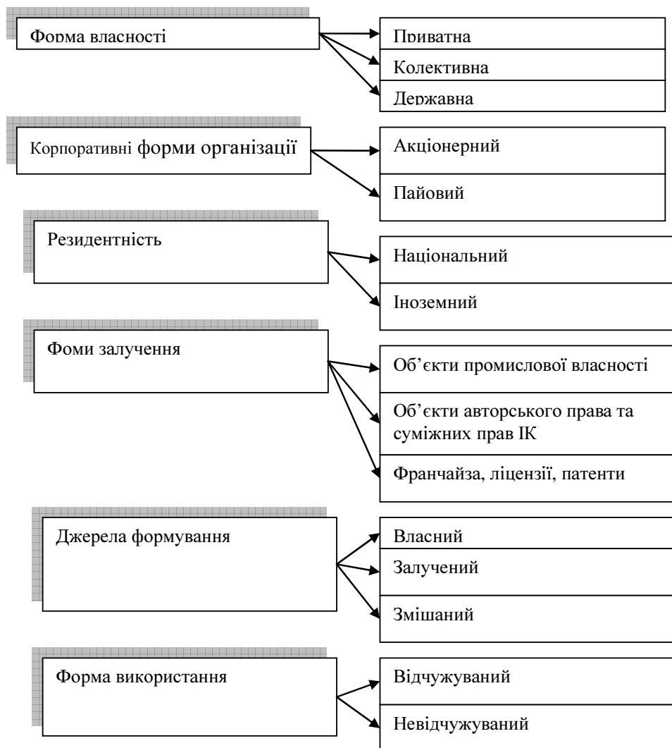
Рис. 2. Типологія видів інтелектуального капіталу

На відміну від інтелектуального ресурсу інтелектуальний потенціал (потенціал від лат. potential – сила, наявність сил, можливостей) являє собою сукупність можливостей, часто ще не розкритих, формально не зафіксованих, але реально існуючих для виконання дій.