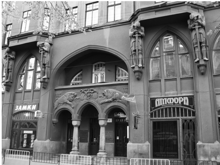
Рис. 4. С.-Р. Пліхаль. Скульптури на фасаді будинку на вул. Князя Романа, 6. 1912–1913

У 1912–1913 роках Пліхаль оздобив фасад будинку Кароля Чуджака і Людвіка Штадтмюллера на вул. Стефана Баторія (тепер князя Романа), 6 (архітектори Адольф Піллер і Роман Вольпель). У зовнішніх формах і декорі будинку вплив німецького “югендстилю” поєднується з характерною для “постісторизму” 1908–1914 років стилізацією європейської архітектури XII–XV ст. Неоромантичний характер будинку особливого виразу набуває у нижній частині, з порталом у вигляді аркадного трифорію, оздобленого барельєфами з левами, а також у могутніх фігурах чотирьох атлантів, представлених як схилені у болісній задумі, сперті на мечях лицарі. Ручки вхідних дверей – це також твори мистецтва, вирішені у формі фантастичних, великих ящірок. Скульптури своєю емоційною виразністю гармоніюють з архітектурними темами.