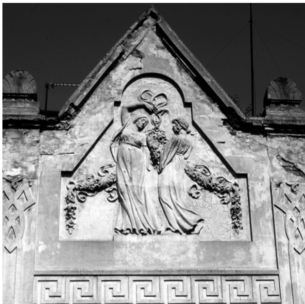
Рис. 2. Я. Рисяк. Аттик будинку на вул. Глибокій, 12. 1910

З мулярським майстром Антоном Яросевичем, власником майстерні на пл. Брестської унії (тепер пл. Липнева), 7, співпрацював невідомий талановитий скульптор. Він був автором кам'яної групи “Immaculata-Caritas” (“Милосердна Богоматір”), встановленої в 1910 р. на фасаді вілли Юліана-Кароля Бернацького на вул. Супінського (Коцюбинського), 36 [12].