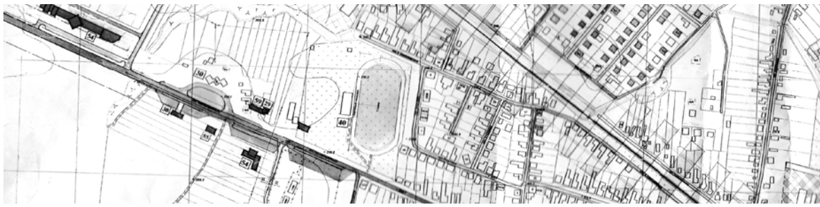
Рис. 5. Фрагмент генплану м. Тячів (територія на в'їзді у місто)