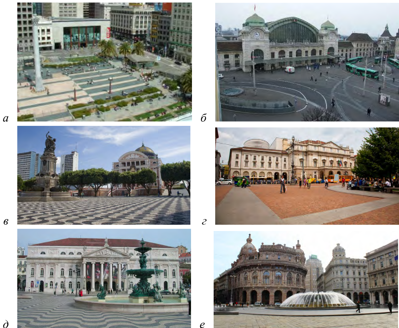
Рис. 3. Передпростори: а – площа перед торговим центром Юніон Сквер Плаза у м. Сан Франциско (США); б – вокзальна площа у м. Базель (Швейцарія); в – театральна площа в м. Амазонас (Бразилія); г – площа перед театром Ла Скала в м. Мілан (Італія); д – площа перед Національним театром в м. Лісабон (Португалія); е – площа Фераррі перед будинком фондової біржі в м. Генуя (Італія)

Як відомо, в містобудівних формах відображається міфологічне мислення та, як влучно узагальнює С. Шубович: “Подобається нам це чи ні, їх необхідно брати до уваги при побудові якої б то не було нормативної теорії”. Такі джерела міфопоетики, як “камені і вода, небо і печера, північ і південь, ознаки старіння, вісь і хода, центр і кордон – все це реалії, з якими повинна рахуватися будь-яка теоретична концепція...” [18]. Загальновідомою є роль води під час закладання міст. Містами, у яких домінують образи-символи “вода” і “камінь”, є Венеція й Амстердам, які “виростають із води” [19].