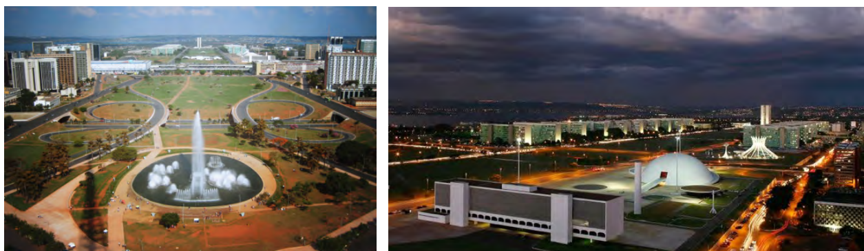
Рис. 2. Площа Трьох влад, Бразилія (Бразилія)

Поведінкові простори несуть подвійне змістове навантаження: забезпечують комфортне середовище для проживання людини і створюють відповідне місце для формування емоційного настрою [17]. Наприклад, площа Трьох влад – центральна площа столиці Бразилії, міста Бразилія, зведена за проектом архітекторів О. Німейсера і Л. Кости, інтегрує діловий, інтимний та парадний простір. У її центрі встановлений тригранний шпиль заввишки 100 м, на вершині якого майоріє прапор Бразилії площею 286 м 2 , окрім того, влаштовано водограй. Через площу проходять основні транспортні магістралі, “монументальні осі” композиції (рис. 2).