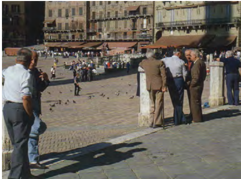
Рис. 4. Вирішення “100 %-го місця” П'яцца дель Кампо в Сієні (Італія)

У 1988 р. Вільям Уайт у праці “Місто: знову відкриваючи центр” вводить поняття “100 %-го місця” – простору, який має усі важливі якості міського простору, що задовольняють практичні та духовні потреби користувачів в органічній гармонійній єдності. Наприклад – П'яцца дель Кампо у Сієні (рис. 4). Має це унікальне поєднання якостей та є взірцевим функціонально-естетичним міським простором, головною репрезентативною площею Сієни. У її просторі