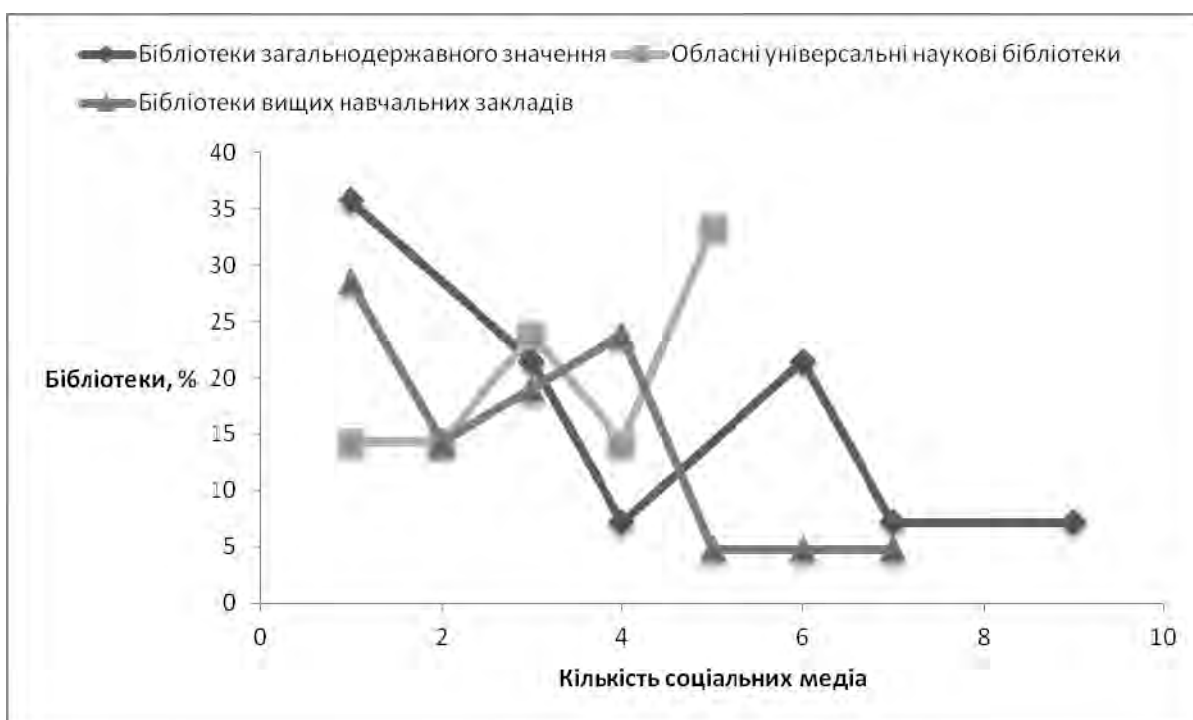
Рис. 2. Охоплення вітчизняними бібліотеками соціальних медіа

Необхідно зазначити, що прослідковується тенденція зосередженості найбільшої кількості бібліотек загальнодержавного значення та бібліотек вищих навчальних закладів у одному та ОУНБ – у п'яти мас-медіа. Порівнюючи ОУНБ з бібліотеками загальнодержавного значення, необхідно зазначити, що в других діапазон охоплення соціальних медіа ширший, але у перших – більша кількість бібліотек охоплює середню кількість мас-медіа. У бібліотек вищих навчальних закладів спостерігається результат близький до показників бібліотек загальнодержавного значення, тобто широкий діапазон охоплення соціальних медіа, але кількість бібліотек, які там представлені – незначна. Специфіка охоплення вітчизняними бібліотеками соціальних медіа представлена у графіку (рис. 2).