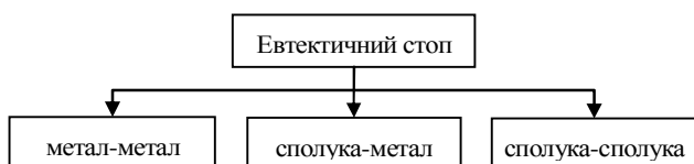
Рис. 2. Класифікація евтектичних стопів за складом речовини

На рис. 2 наведено класифікацію евтектичних стопів за складом речовини.