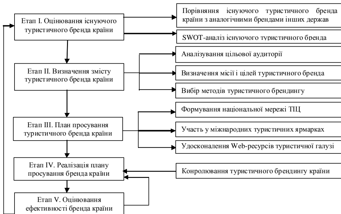
Рис. 3. Схема стратегії просування туристичного бренду країни

Для покращення реалізації завдань, поставлених після створення національного бренду, розробимо відповідну модель формування стратегії просування туристичного бренду країни, схема якої зображена на рис. 3.