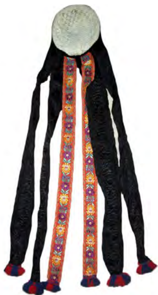
Рис. 4. Обрядовий чепець, с. Рекіти Міжгірського району. Гачковане мереживо, фабричні стрічки. Початок ХХ ст.