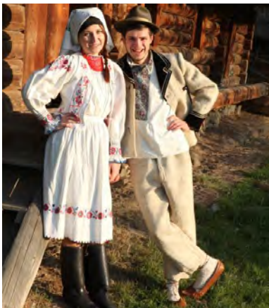
Рис. 7. Молода пара в традиційному народному вбранні, с. Гукливий Воловецького району. Реконструкція, 2014 р.

Для проведення реконструкції відібрано 16 одягових комплексів, які представляли як всі адміністративні райони краю, так і всі етнографічні групи українців Закарпаття, а також одягові традиції угорців і румунів краю. За якихось 15–20 хвилин сучасна молодь “перевтілилась”, вдало ввійшовши в роль гуцулів, бойків, лемків і долинян. Первинна скромність та замкнутість студентів швидко змінилися на емоції, радість, гордість за традиції своїх дідів-прадідів. Більшість з студентів прагнули одягнути народне вбрання рідного району. Відповідний настрій значно полегшив роботу фотографу-професіоналу Ярославу Макару (рис. 7, 8).