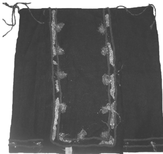
Рис. 5. Весільна сукня, с. Ясіня Рахівського району. Чорне сукно, фабричні стрічки. 20–40-ві рр. ХХ ст.

Разом із науковим дослідженням традиційне народне вбрання є важливим джерелом для популяризації культурної спадщини нашого краю. Різноманітні аспекти популяризації традиційного народного вбрання краю можна поділити на дві основні групи: статичні та атракційні.