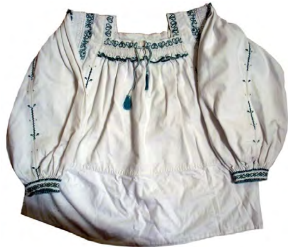
Рис 3. Жіноча сорочка, с. Солотвино Тячівського району. Домоткане полотно, вишивка, низина. 30-ті роки XX ст.

Для вивчення традиційного народного вбрання не менш важливим є з'ясування його функціонального призначення. Тут можемо простежити таку лінію: буденний одяг – простий, святковий – пишно декорований, обрядовий – символічний. Одяг є яскравим виразником повсякденного побуту, святкової урочистості та обрядової символічності. Використання різних елементів народного вбрання у родинній обрядовості вказує на тісний зв'язок матеріальної і духовної культури . Прикладами суто обрядового вбрання на Закарпатті є такі його складові як гуцульська сукняна спідниця (“літник”, “сукня з огальоном”), широкий тканий жіночий весільний пояс у тересвянських долинян, чепець у бойків та дівочий головний убір (велике біле полотнище (“білило”)) у бойків і лемків Закарпаття, весільні барвінкові вінки. Серед них можемо виділити бойківський чепець та гуцульську спідницю.