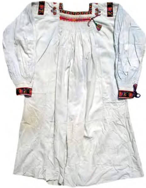
Рис 2. Жіноча сорочка, с. Дубове Тячівського району. Домоткане полотно, вишивка, низина, хрестик. 20-ті роки XX ст.