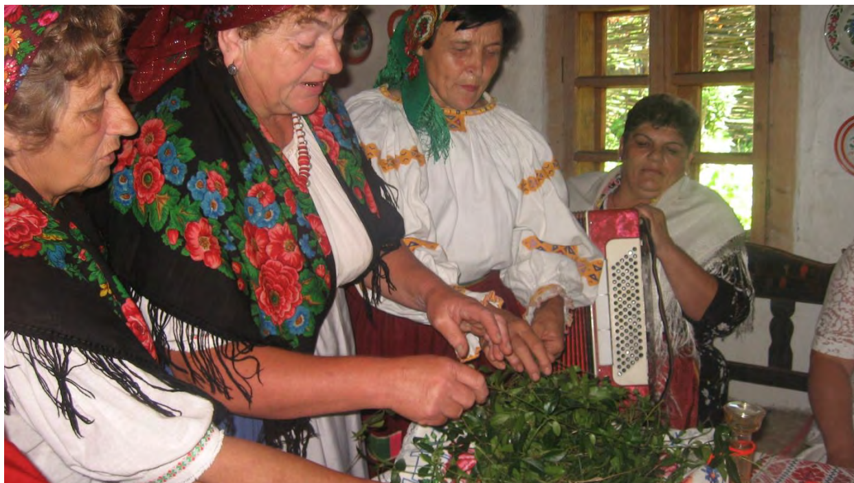
Рис. 6. Плетіння весільних барвінкових вінків. Фрагмент традиційного народного весілля в ужгородському скансені, 2008 р.

Дослідження традиційного одягу дають змогу через виставкову роботу фрагментарно відтворювати традиції проведення свят річного календарного циклу (Різдва, Стрітєння, Великодня, Покрови тощо). Останніми роками доброю традицією стали щорічні виставки, присвячені одному із найбільших релігійних свят – Великодню. Тематико-експозиційний план виставок щороку доповнюється, удосконалюється. Але обов'язковим завжди є використання комплектів або окремих складових традиційного вбрання українців Закарпаття. У 2011 р. у виставковому залі працівники музею відтворили давню селянську хату, ошатно прибрану до Великодніх свят. На стінах висять ікони і тарілки, на жердині розвішені декоративні грядкові рушники, на столі – кошик із щойно освяченою паскою та неодмінні атрибути Великодня – писанки. Привертає увагу лавиця, біля якої зручно примостилися маленькі хлопчик і дівчинка, радісно забавляючись із писанками. Окрім цього, символічна сільська громада, яка складається з представників різних куточків Закарпаття, ніби завмерла, очікуючи на освячення пасок священником [33, с. 12].