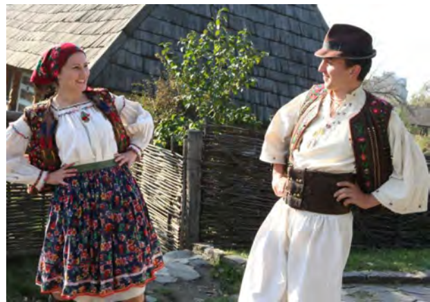
Рис. 8. Молода пара в традиційному народному вбранні, с. Бедевля Тячівського району. Реконструкція, 2014 р.