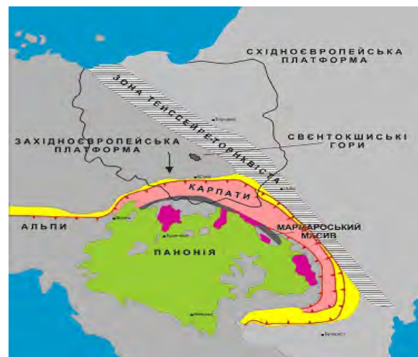
Рис. 1. Розташування Свентокшицьких гір у Польщі та Мармароського масиву в Україні та напрям стискувальних зусиль (↓) для Польських Карпат [М. Jarosinski, 1997]

Відносно першого регіону за даними гравіметричних досліджень і їх інтерпретації пояснили геодинамічні умови його формування, відповідно до теорії літосферних плит і наявності магматичних порід, як масив, зірваний зі свого субстрату і переміщений в останню фазу Карпатської складчастості до північного сходу [Ю. Крупський, В. Марусяк, 2011 р.]. Свентокшицькі гори в Польщі розташовані в межиріччі рік Вісли і Камінної. В Свентокшицьких горах на поверхні відслонюються відклади еокембрію, кембрію, силуру, девону, тріасу, юри, нижньої крейди. На південному сході й північному заході гори обрамляються відкладами молас міоцену, на північному сході й південному заході – відкладами юри і верхньої крейди польської низовини, яка прилягає до Краківсько-Сльонзького підняття.