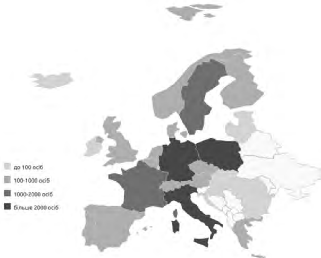
Рис. 3. Кількість поданих громадянами України заяв на отримання притулку в країнах ЄС у 2014 р.

Відповідно до розрахунків, які надає Управління у справах біженців ООН (УВКБ ООН), 314 000 осіб є шукачами притулку за межами України та 463 250 використовують інші механізми для того, щоб залишатися за кордоном. Щодо шукачів притулку в країнах ЄС, то на 2014 р. від громадян України було подано 14 405 прохань про притулок порівняно з 1120 у 2013 році. За цей період було розглянуто 1570 заявок, з яких щодо 420 рішення були позитивними (35 – статус біженця, 305 – додатковий захист, 80 – гуманітарні причини), 1150 було відхилено (рис. 3) [7].