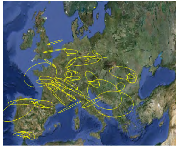
Рис. 3. Приклад картосхеми з еліпсами розсіювання магнітуди епіцентрів землетрусів на території Європи за даними сейсмічних станцій у 2007 році

еліпса розсіювання та інтегральним зміщенням [Третяк, Серант, 2008]. На рисунку 4 виділена територія для якої кореляція знаходиться в межах 0,6-0,9. Для решти території кореляційний зв'язок відсутній.