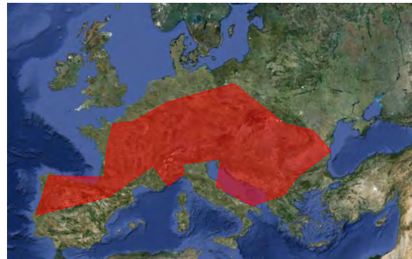
Рис. 4. Територія з високим ступенем кореляції