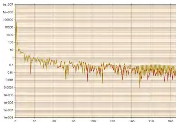
Рис. 3. Абсолютні значення зональних гармонічних коефіцієнтів EGM2008 (червоний) та нашої моделі після регуляризації (оливковий)

З рисунка 1 видно що отриманий розв'язок досить непогано співпадає з модельним до 150 по-