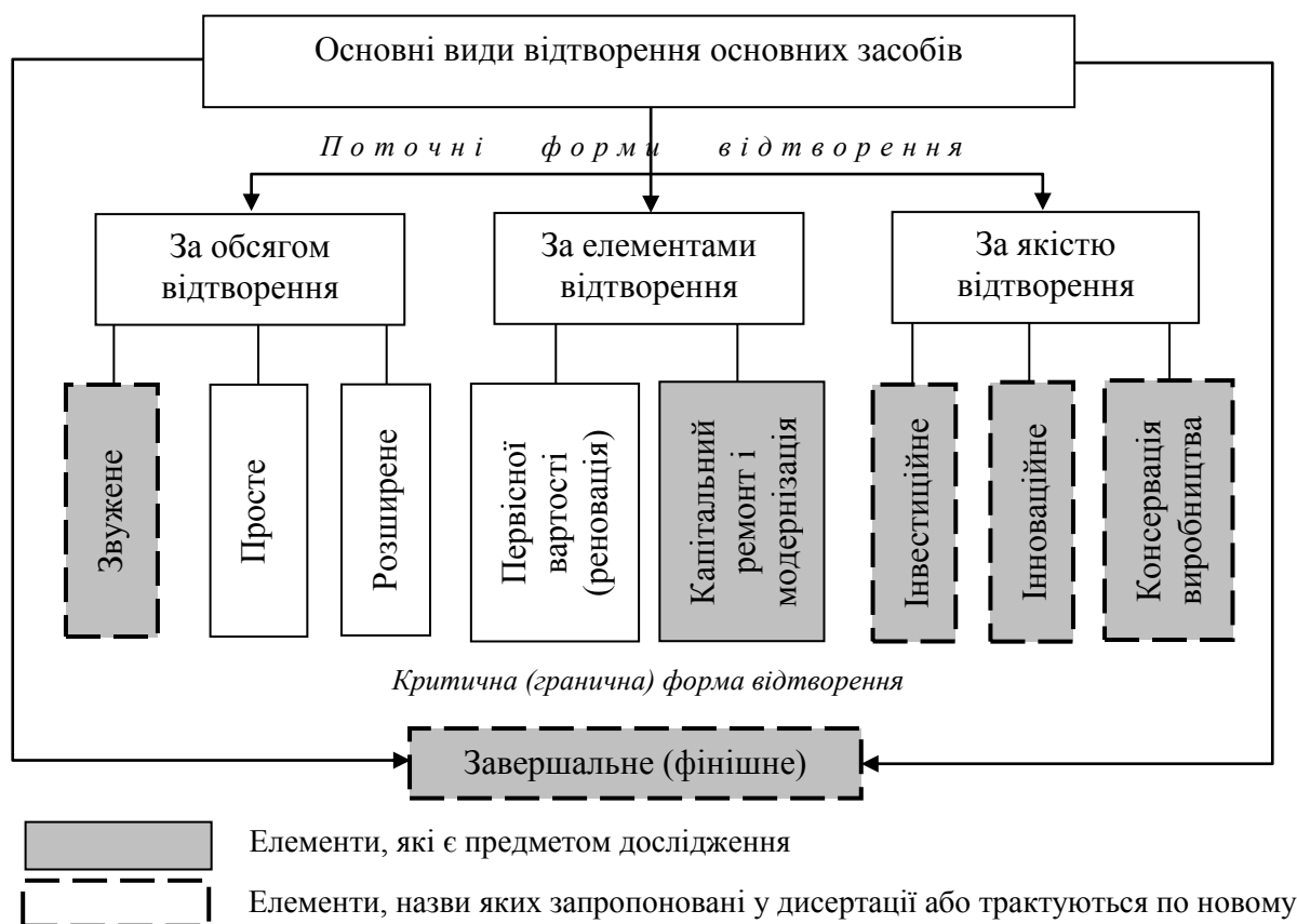
Рис. 1. Основні види і форми відтворення основних засобів

Переглянуто і доповнено також класичні види відтворення (рис. 1).