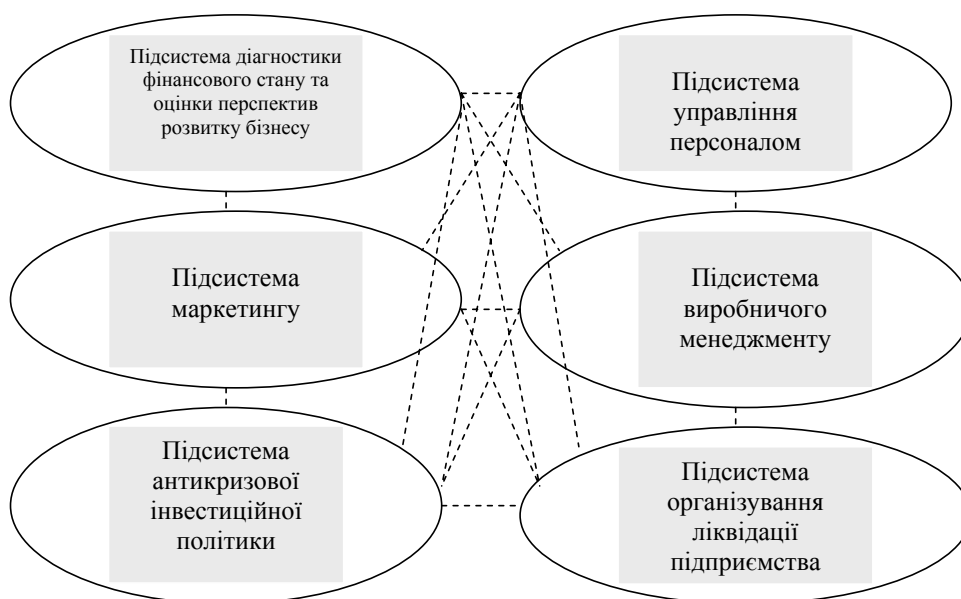
Рис. 1. Перелік і можливий взаємозв’язок основних підсистем у складі механізму антикризового управління підприємством *

Широкий взаємозв’язок підсистем антикризового управління підприємством, а також неперервний вплив на їх дієздатність внутрішнього і зовнішнього середовищ формує підґрунтя для виникнення різноманітних конфліктних ситуацій, й основною метою підприємницьких структур є запобігання їм.