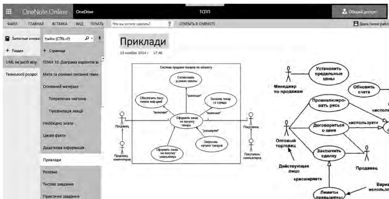
Рис. 3. Відображення сторінки «Приклади»

Слід наголосити, що використання Microsoft OneNote не може замінити такі широковідомі у освітньому середовищі платформи, як Moodle, EdX, Lotus Domino, ATutor OLAT. Цей інструмент доцільно використовувати як корисний додаток до тих СНД, які вже працюють у багатьох ВНЗ.