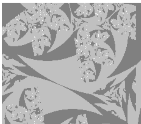
Рис. 2. Вхідне зображення

Вхідне зображення, що використовувалося в одному із експериментів, наведене на рис. 2 (тип – 2-байтовий напівтоновий (grayscale), розмірність – 231 \times 199 пікселів).