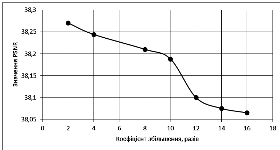
Рис. 4. Значення співвідношення сигналу до шуму за різних значень коефіцієнта збільшення