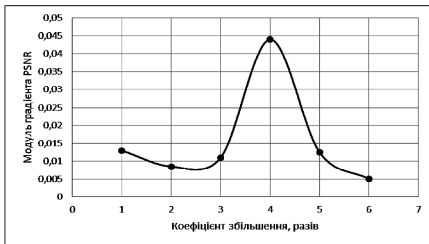
Рис. 5. Модуль градієнта PSNR