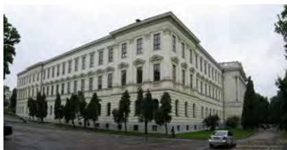
Рис. 1. Вхідне зображення

Проведемо комп’ютерне моделювання запропонованого методу. Як контейнер, в який буде вбудовано дані, використаємо зображення (рис. 1). У цій роботі використаємо один з найпростіших підходів до вбудовування даних – LSB-алгоритм.