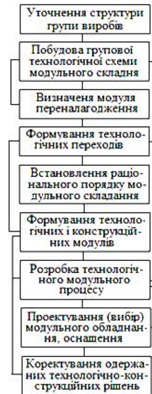
Рис. 2. Схема побудови типового модульного процесу гнучкого складання