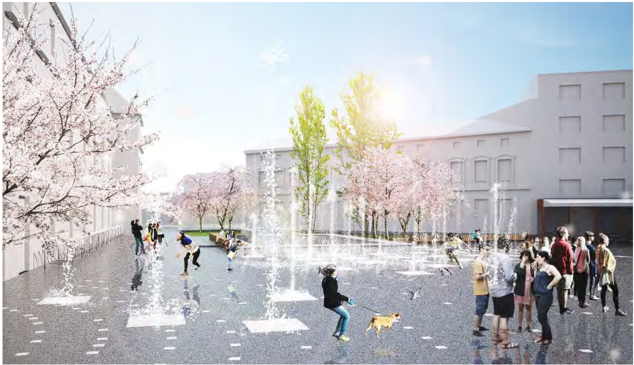
Рис. 2. Візуалізація ревіталізації площі Митної у Львові (Рисунок виконали у рамках воркшопу його учасники.)

Наступним кроком воркшопу є пошук засобів та інструментів :