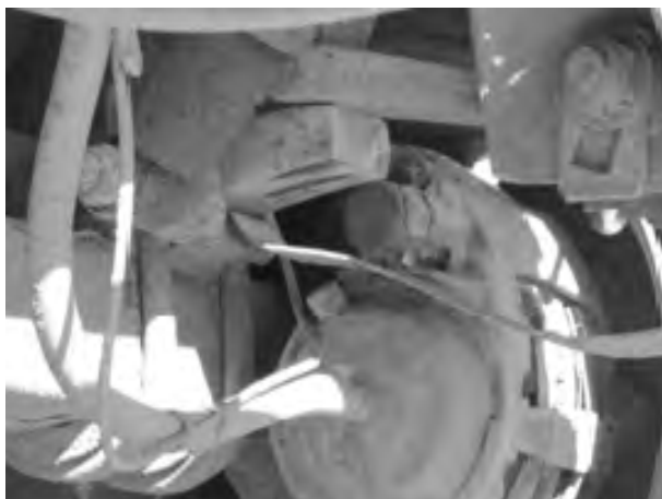
Рис. 2. Світлина несправної підвіски автопоїзда Volvo FH12

встановлено, що найчастіше в підвісці напівпричіпа руйнується напівресора. Загальний вигляд зламаної напівресори автопоїзда Volvo FH12 і самого злому наведено на рис. 2, 3 відповідно. Водій автомобіля під час зовнішнього огляду виявив несправність, яка полягала у зламаній півресорі. Причиною міг бути заводський дефект, втомне руйнування матеріалу півресори, нерівність дорожнього покриття.