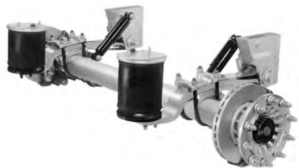
Рис. 1. Підвіска напівпричіпа автомобіля з півресорою SAF Modul

Спостереження і збирання відповідної інформації виконували від моменту прийняття автомобіля на обслуговування із спілкуванням з водієм на предмет встановлення прояву несправностей, виконання розбирання дефектних вузлів підвісок і оцінювання їх технічного стану, до моменту завершення замінних операцій і внесення відповідних записів у базу даних СТО і супроводжувальну документацію. На основі доступу до баз даних підприємства