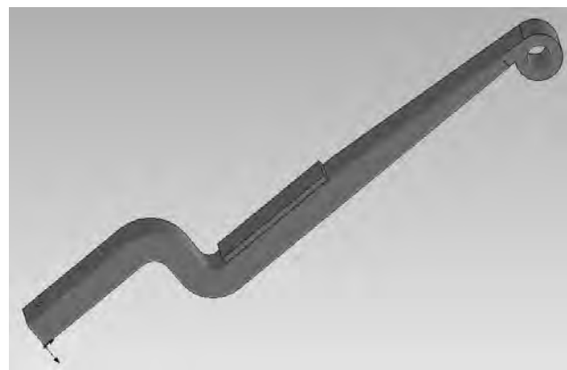
Рис. 7. Вигляд півресори з проставкою між віссю і півресорою