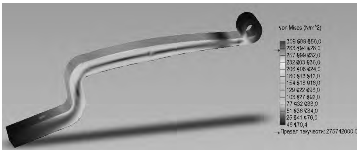
Рис. 4. Поля напружень, які виникають у півресорі напівпричіпа автомобіля

Для визначення напружень, які виникають у півресорі підвіски причіпа автопоїзд, використано програму SolidWorks – програмний комплекс САПР для автоматизації робіт промислового підприємства на етапах конструкторської та технологічної підготовки виробництва [4]. Для встановлення напружень, які виникають у небезпечних перерізах півресори було проведено моделювання в середовищі SolidWorks Simulation Xpress. Задавши матеріал півресори і дію на неї сил від пневмобалона і осі за допомогою методу кінцевих елементів встановлюємо напруження, які виникають в ресорі (рис. 4). Аналіз напружень, які виникають у півресорі, дозволив визначити основні небезпечні перерізи (рис. 5).