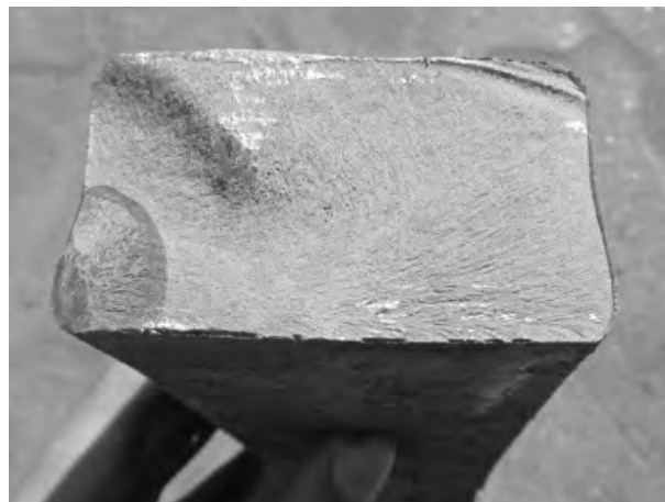
Рис. 3. Світлина розламаної півресори

На рис. 3 чітко виражена початкова маленька тріщина, причиною якої міг бути удар внаслідок нерівностей дорожнього покриття або втома матеріалу півресори, в результаті чого вона розламалась на дві частини.