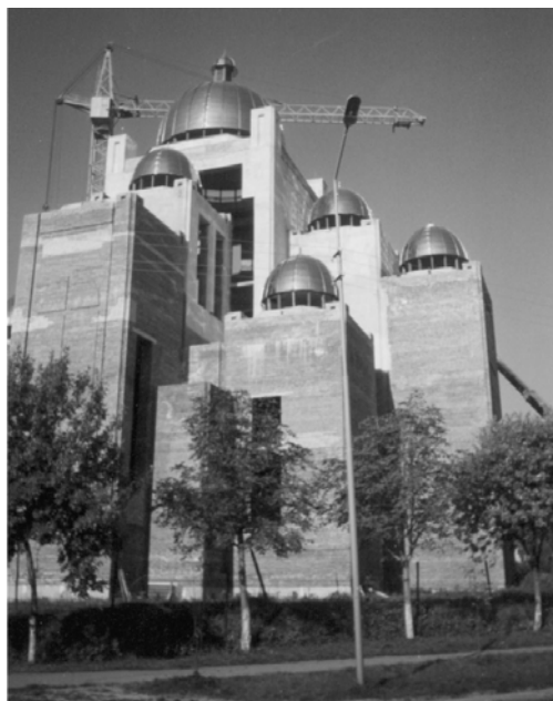
Рис. 2. Церква Всіх Святих українського народу, ріг вул. Петлюри–Кульчицької