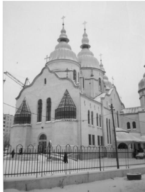
Рис. 3. Церква Вознесіння ГНІХ, вул. Широка

Навпаки, храм Різдва Пресвятої Богородиці, що на Сихові, розміщено на незначному підвищенні стосовно головного проспекту у відкритому просторі і має п'ятиверху, тридільну планувально-просторову структуру шоломоподібних за формою завершень бань, де ритміка його прямокутних обсягів достатньо гармоніює з ритмікою навколишньої забудови цього мікрорайону, проте ритміка цього храму виразніша та пропорційніша. Подібною до храму Різдва за ритмікою і формами членувань є споруджувана на вул. Кульчицької церква Всіх Святих українського народу, яку можна віднести до хрещатого планувального типу, з 14-баневим, шоломоподібним типом завершення. Проте впадають у вічі дещо перебільшені обсяги архітектонічних членувань стосовно невеликих за масами бань, хоча ця храмова будівля має своє формально-домінантне, емоційне звучання на тлі житлового середовища.