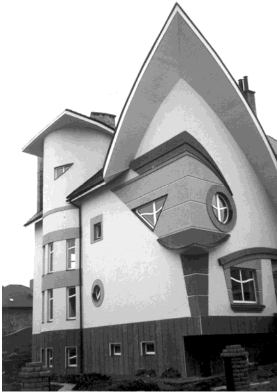
Рис. 1. Житловий будинок у Чернівцях (арх. А. Аршинін, Н. Горбачова)