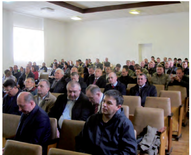
На пленарному засіданні