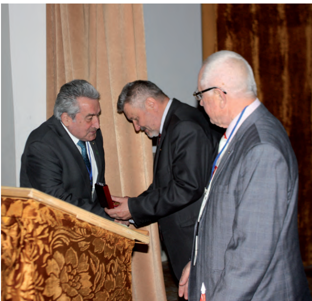
Одержання нагород від Українського товариства геодезії і картографії