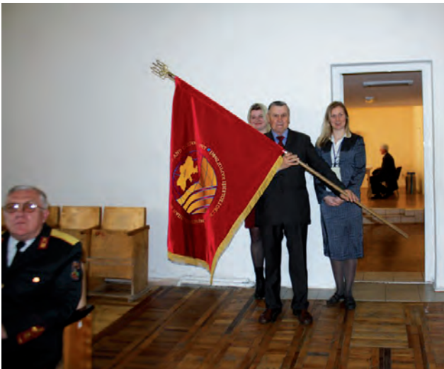
Внесення прапора УТГК