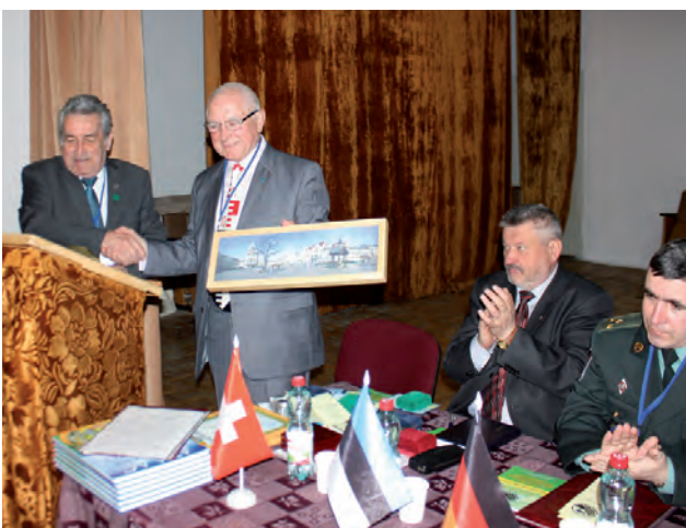
Привітання від іноземних делегацій