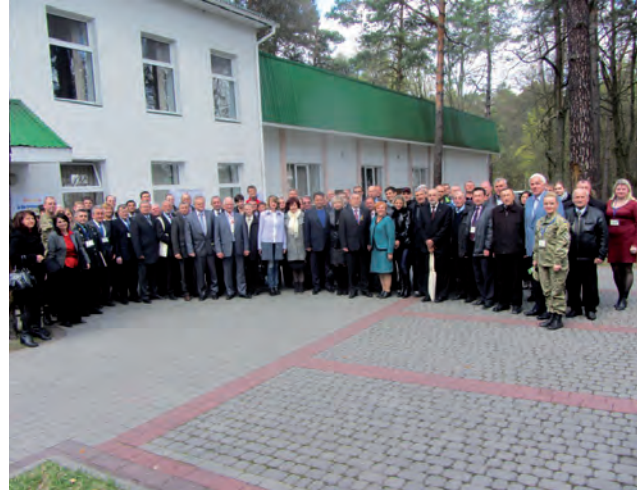
Учасники XX МНТК "Геофорум-2015"