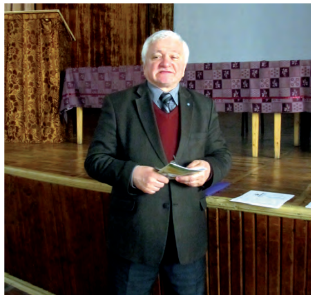
Виступає генеральний секретар Асоціації геодезистів Європи В. Кіріак