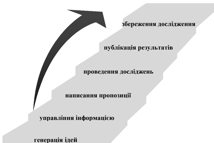
Рис. 1. Етапи циклу досліджень