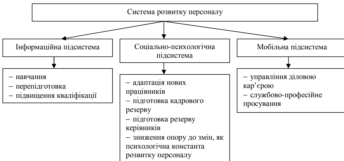
Рис. 2. Підсистеми розвитку персоналу

Технічна система – ефективне поєднання технічних засобів. Технологічна система основана на поділі діяльності організації на стадії і процеси. Організаційна система із розробленням структури управління, відповідних положень і інструкцій дає змогу раціонально використовувати технічні засоби, предмети праці, інформацію, площі і трудові ресурси. Економічна система – це єдність господарських і фінансових процесів та зв'язків, а соціальна – це сукупність соціальних відносин, які утворюються в результаті спільної діяльності людей і соціальних груп.