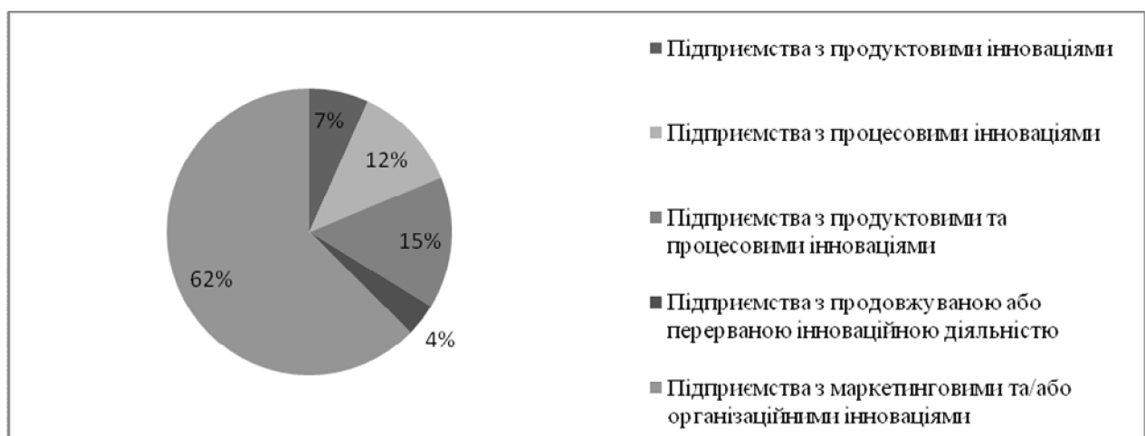
Рис. 1. Розподіл інноваційної активності малих підприємств за видами впроваджуваних інновацій протягом 2010–2012 років

За даними Державної служби статистики [8], рівень інноваційної активності вітчизняних малих підприємств протягом 2008–2010 років є таким: із 26521 обстежених лише 4874 підприємства були інноваційно активними. У 2010–2012 роках ситуація погіршилась: з 24657 обстежених малих підприємств інноваційно активними були 4170. Структуру впроваджених малими підприємствами видів інновацій протягом 2010–2012 років подано на рис. 1.