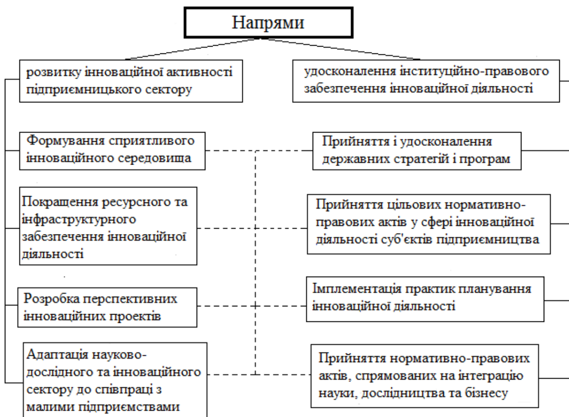
Рис. 4. Напрями підвищення рівня державної підтримки інноваційної активності малих підприємств [17]

Наведені напрями підвищення рівня державної підтримки інноваційної діяльності малих підприємств можуть бути прийнятними за умови активізації зусиль усіх органів державної влади на їх досягнення. Проте, враховуючи сучасну економічну та політичну ситуацію в країні, для керівництва держави інноваційний розвиток малих підприємств не є пріоритетом, тому керівники малих інноваційних підприємств повинні розраховувати лише на власні сили.