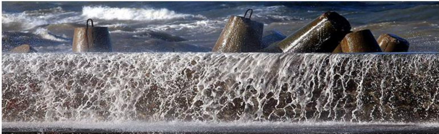
Bałtycka Biblioteka Cyfrowa