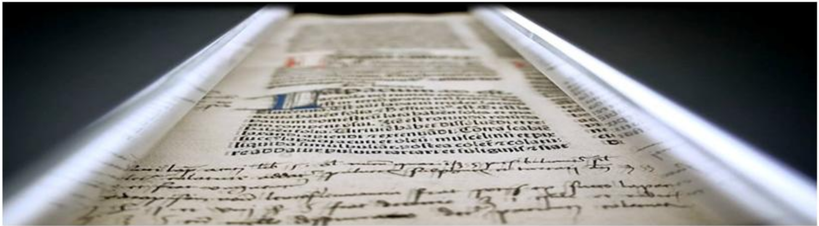
Śląska Biblioteka Cyfrowa – proces skanowania