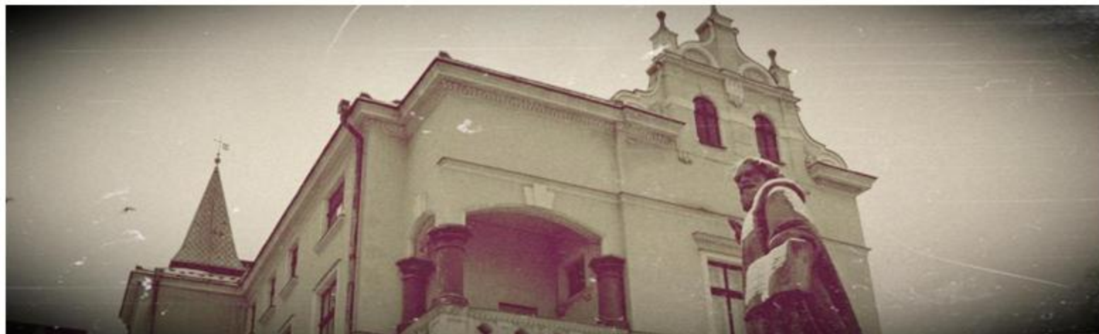
Sanocka Biblioteka Cyfrowa