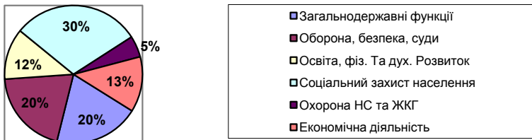
Рис. 2. Структура видатків державного бюджету в 2013 р.

Оскільки, Україна є однією з держав, де найвищі податки, то збільшувати їх, навіть в цілях подолання бюджетного дефіциту, є недоцільним методом і, більше того, може призвести до розвитку тіньового сектора економіки. Тому, найбільш дієвим і обґрунтованим способом подолання розмірів бюджетного дефіциту має бути скорочення видатків державного бюджету. Укрупнена структура видатків державного бюджету станом на 2013 р. представлена на рис. 2.