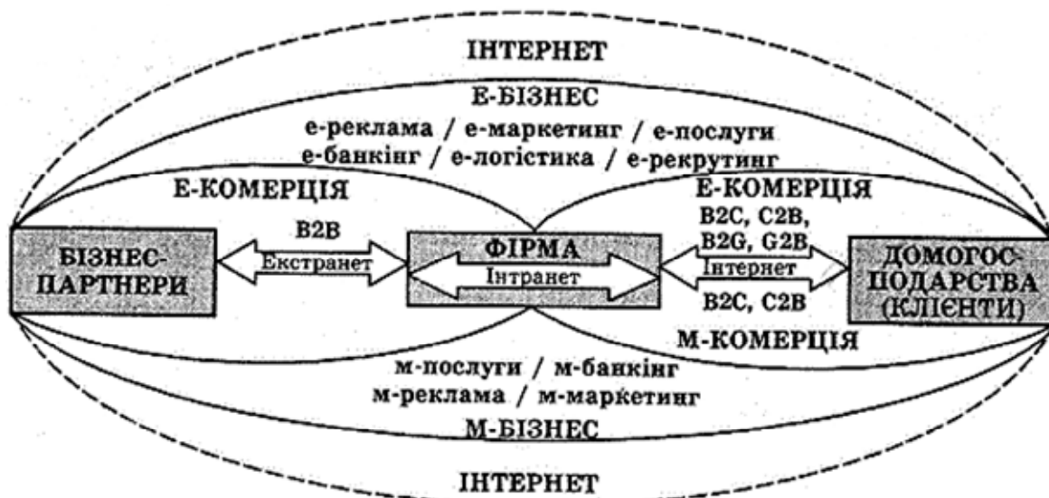
Рис. 1. Структура взаємодії та інформаційно-технологічне середовище електронного бізнесу

Щодо певного історичного поступу, електронна комерція поступово пройшла етапи уніфікації та стандартизації різних систем електронного обміну. У 80-х роках XX ст. на базі англійських та американських стандартів міжнародна організація із стандартизації ISO розробила новий стандарт Electronic Data Interchange for Administration, Commerce and Transport (EDIFACT, ISO 9735). Одночасно динамічно зростали обсяги електронної торгівлі, а також кількість компаній, які її здійснювали. Так, у 1996 р., коли торгівля за допомогою Інтернету лише формувалася, обсяг EDI-трансакцій становив 300 млрд дол. США, а в 1999 р. – 1,1 трлн дол. США.