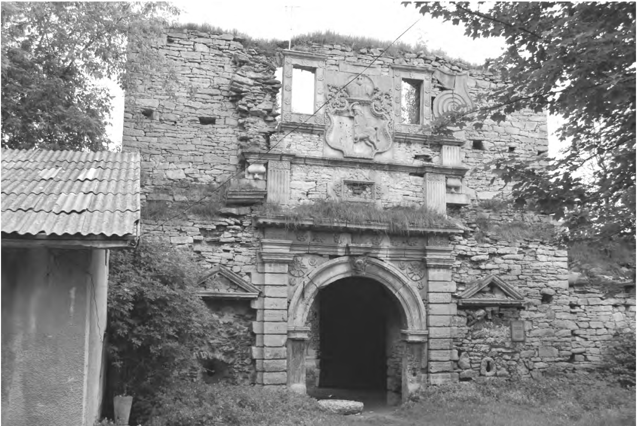
Рис. 2. Головний фасад замкової брами, унікальна ренесансова різьба. Сучасний стан