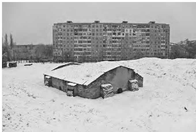
Рис. 3, 4. Все що залишилось від колись могутньої фортеці Тирасполь – порохівня