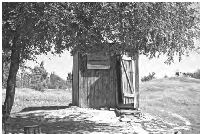
Рис. 5. Ознакування місця фортеці