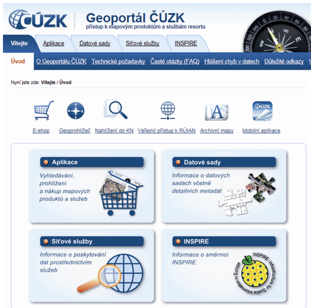
Комплекты данных, доступные на портале ЧЗКУ