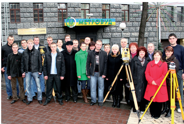
Колектив дочірнього підприємства “Укргеодезмарк” ПАТ “Київметробуд” Корпорації “Укрметротунельбуд”

Створення планово-висотного обґрунтування для будівництва метрополітенів у м. Києві, Дніпропетровську, Донецьку на поверхні та під землю, гіроскопічне орієнтування. Геодезично-маркшейдерський супровід та топографічне знімання масштабу 1:500 під час будівництва Київського метрополітену