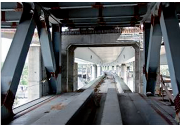
Створення планово-висотного обґрунтування, контрольні інженерно-геодезичні роботи, виконавче знімання під час будівництва Подільського мостового переходу (м. Київ)