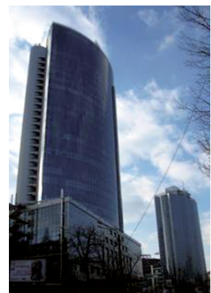
Інженерно-геодезичні роботи з контролю геометричних параметрів будівництва та моніторинг висотних будівель