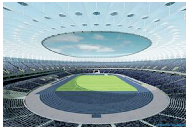
Інженерно-геодезичний контроль збирання і монтажу металокаркасних дахів під час реконструкції НСК "Олімпійський" м. Київ і будівництва стадіону "Арена" у м. Львові для Євро-2012