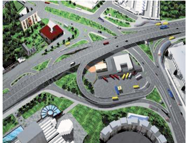
Створення планово-висотного обґрунтування, контрольні інженерно-геодезичні роботи, виконавче знімання під час будівництва транспортних розв'язок на Московській площі, біля ст. м. "Дніпро", проспекту Науки і Столичного шосе, тривірневої розв'язки біля моста Патона і під час будівництва Гаванського моста (м. Київ)