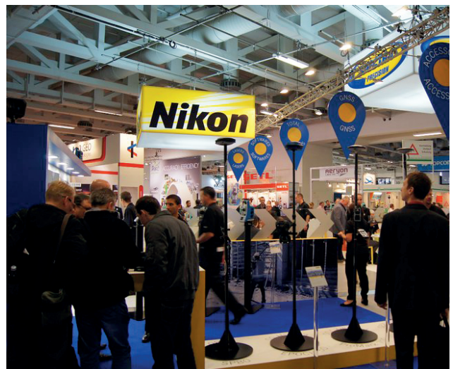
У павільйоні фірми Nikon