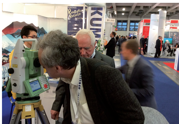
Ознайомлення із приладами фірми Leica

Наступний конгрес INTERGEO заплановано в місті Штутгарт у жовтні 2015 року.