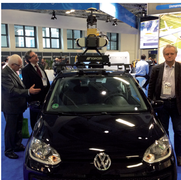
Ознайомлення із мобільною лазерною системою сканування