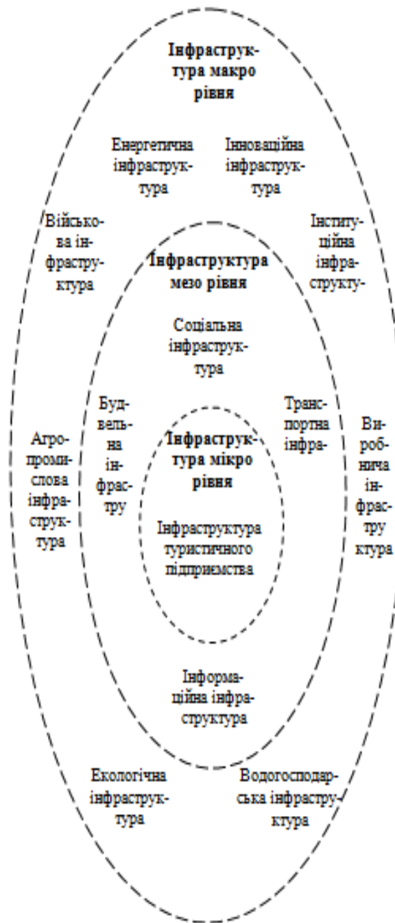
Рис. 2. Схематичне формування туристичної інфраструктури за рівнями вагомості впливу на розвиток сфери туризму

4) Принцип взаємодоповнення. Впродовж історії розвитку світового господарства чітко простежується закономірність, що з появою одного інфраструктурного елементу виникає необхідність, котра чітко витікає із економічної доцільності, створення іншого. Комплексне використання складових інфраструктури забезпечує синергійний ефект та сприяє розвитку не лише туризму, а й інших галузей народного господарства.